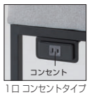
1口コンセントタイプ

背・座/布張り、ウレタンフォーム 木枠/合板、カポール 脚部/21×21スチール角パイプ、粉体塗装(ブラック)